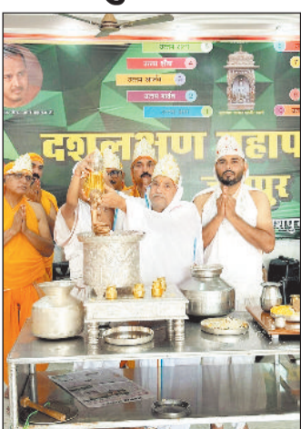
पहले दिन को 'उत्तम क्षमा' के रूप में मनाया गया। क्षमा का अर्थ है क्रोध, द्वेष, ईर्ष्या और वैर जैसे नकारात्मक भावों का

आत्मा को पापबंधन से मुक्त करना और मोक्षमार्ग की ओर अग्रसर होना है। 'अहिंसा परमो धर्मः' के मूल सिद्धांत को आत्मसात करते हुए दिगंबर जैन अनुयायी इन दस दिनों तक गहन साधना में लीन रहते हैं। उपवास, सामाजिक, स्वाध्याय, प्रतिप्रणम, दान और तपस्या इस पर्व का मुख्य अंग है।