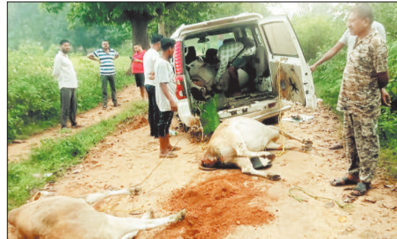
पिकअप से गौवंश बरामद करती पुलिस।

जशपुरनगर। चार दिनों के भीतर लोदाम थाना, पंडरापाठ चौकी व करडेगा चौकी क्षेत्र में की गई अलग-अलग कार्रवाई में पुलिस ने कुल 25 गौवंशों को आरोपियों के चंगुल से मुक्त कराया है। इस दौरान दो आरोपियों को गिरफ्तार कर जेल भेजा गया है। अन्य आरोपी फरार हैं। पुलिस ने तस्करों में प्रयुक्त दो पिकअप और एक स्कॉर्पियो वाहन भी जब्त किया है।