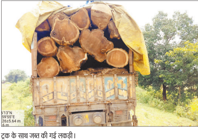
ट्रक के साथ जब्त की गई लकड़ी।

सूत्रों से मिली गुप्त जानकारी पर की गई इस कार्रवाई ने अवैध कारोबार करने वालों में हड़कंप मचा दिया है। विभाग का कहना है कि कंडोरा इलाके में लंबे समय से लकड़ी की अवैध कटाई और भंडारण की शिकायतें मिल रही थीं।